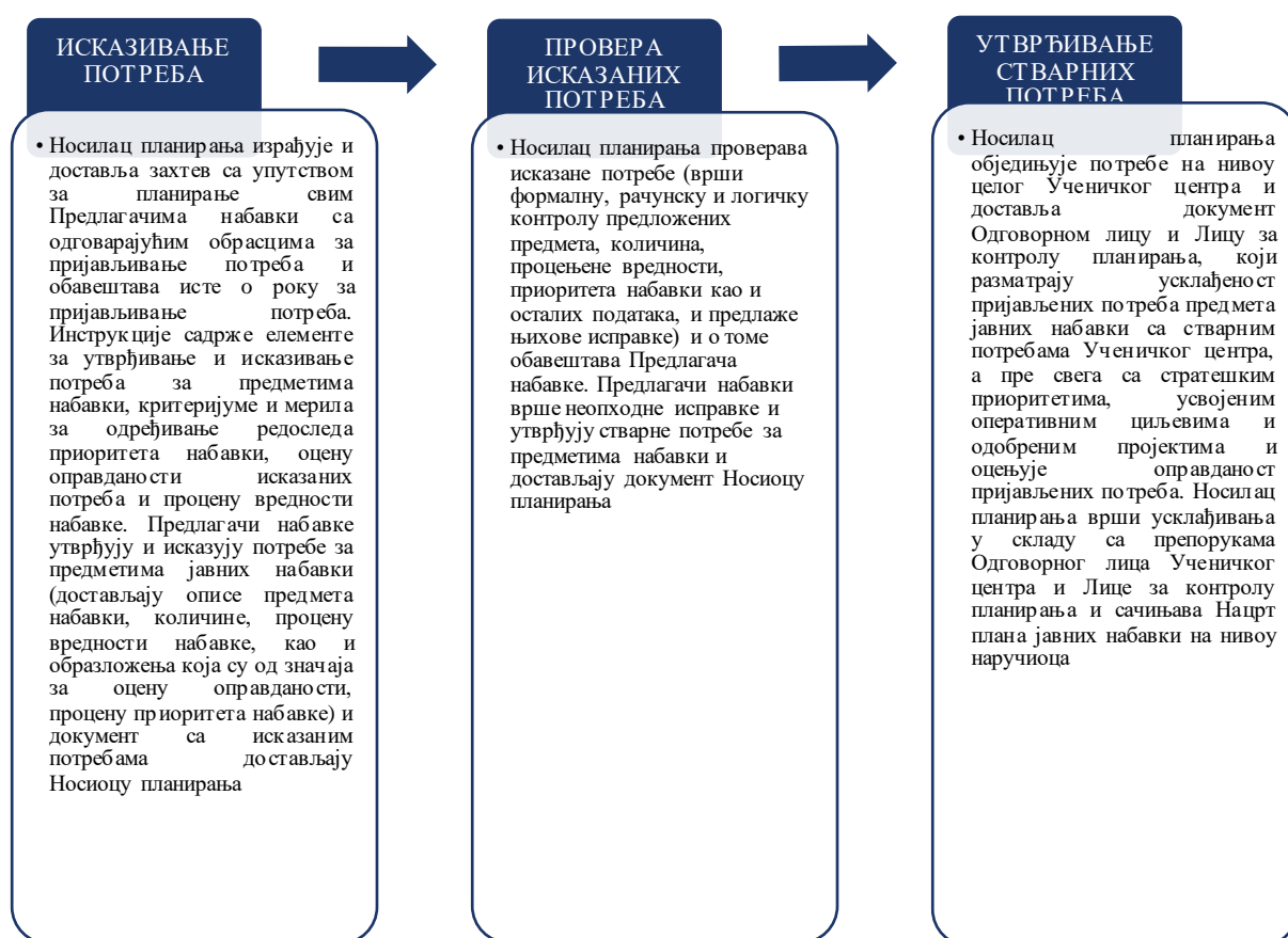
Слика број 4: Процес утврђивања стварних потреба за предметом набавке

Чланом 9. Правилника о ЈН из 2020. године, дефинисано је да: носилац планирања, пре почетка поступка пријављивања потреба за предметима набавки, доставља Предлагачима